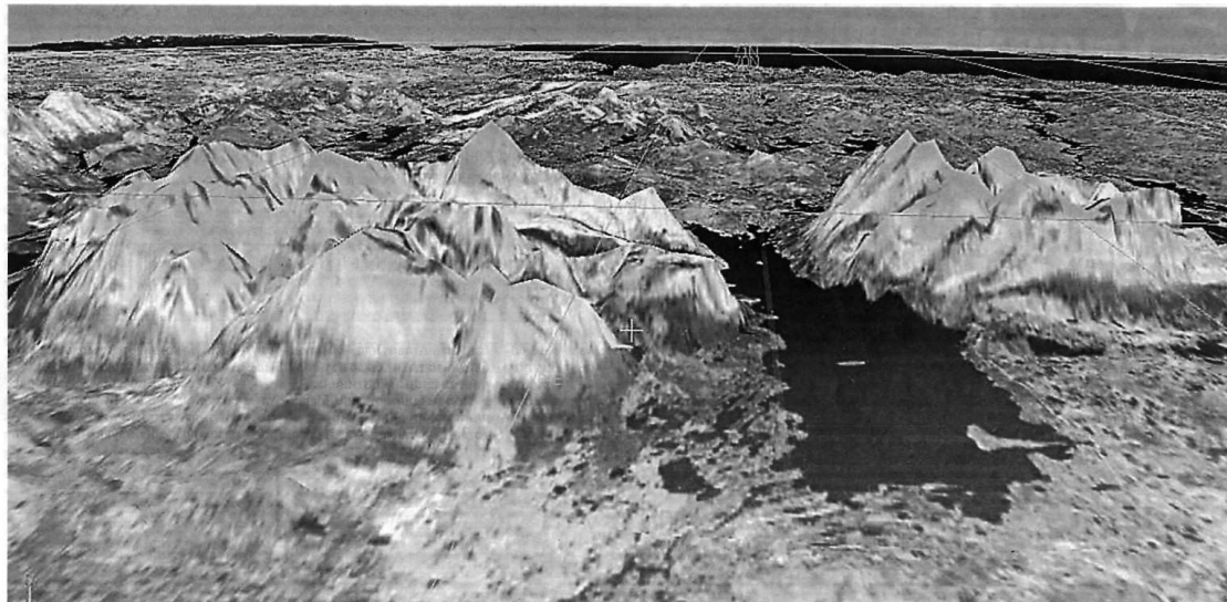
Геркулесовы Столбы — программа Freeware Nasa World Wind.

Если взять географию местности, она тоже совпадает с описаниями Платона. Около Атлантиды много других островов и над ними Атлантида господствует, пишет философ. Белое море усеяно островами. Остров находится на тихом, неглубоком море. Его окружает континент, а длинный вход, похожий на канал, со-